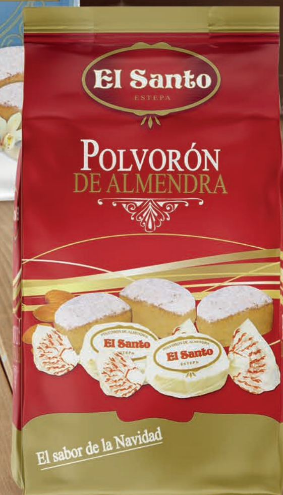
REF. 10184 Bolsa Polvorón de Almendra 400 g Medidas: 220x110x75 mm 24 uds./caja 30 cajas/palet