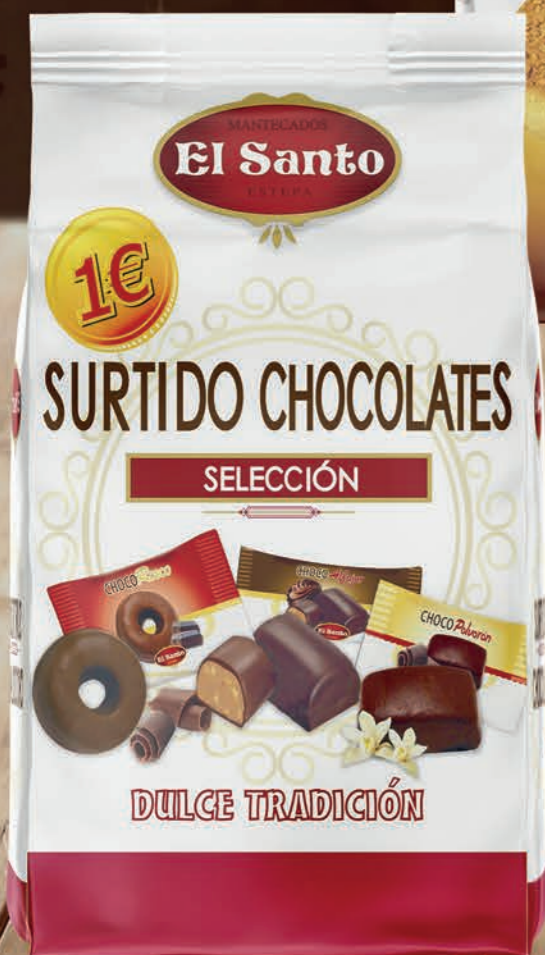
REF. 400045 Bolsa Surtido Selección Chocolate 180 g Medidas: 210x110x75 mm 12 uds./caja 72 cajas/palet