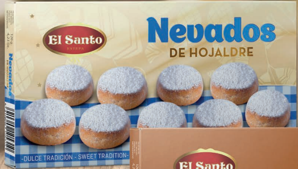
REF. 10186 Estuche Glaseados de Hojaldre 120 g Medidas: 290x154x30 mm 30 uds./caja 36 cajas/palet