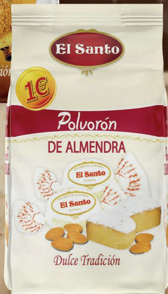
REF. 10169 Bolsa Polvorón de Almendra 180 g Medidas: 210x110x75 mm 12 uds./caja 72 cajas/palet