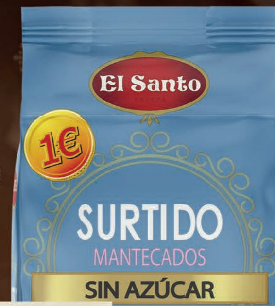
REF. 10152 Bolsa Surtido Sin Azúcar 180 g Medidas: 210x110x75 mm 12 uds./caja 72 cajas/palet