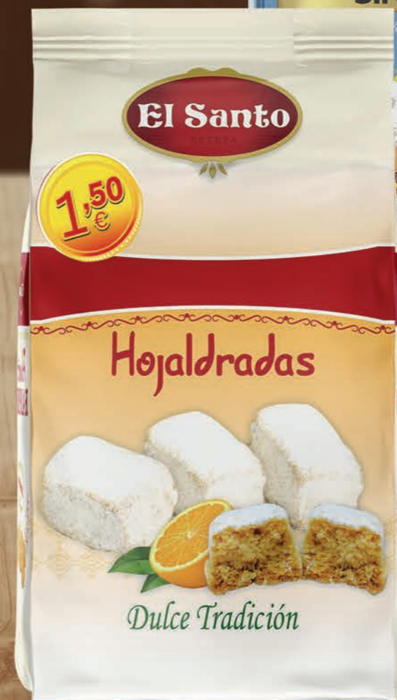
REF. 400055 Bolsa Hojaldradas 200 g Medidas: 210x110x75 mm 12 uds./caja 72 cajas/palet