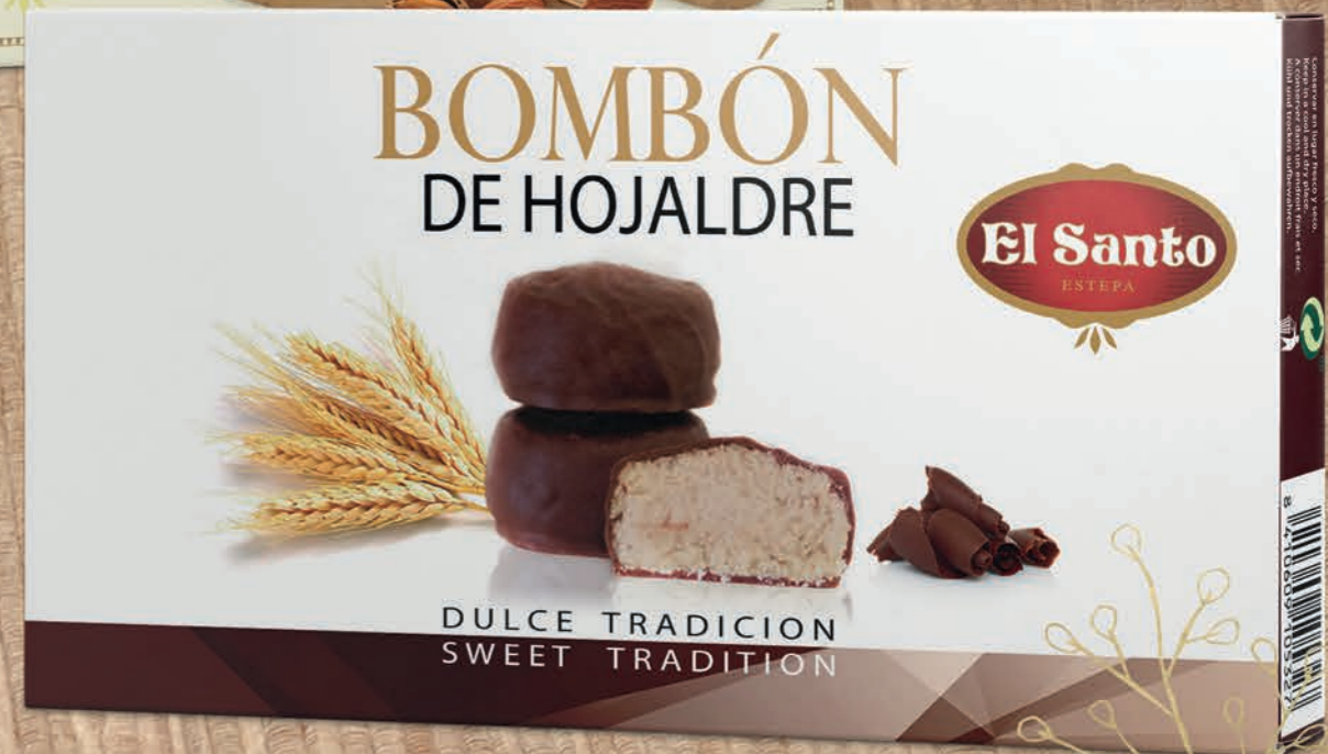
REF. 10187 Bombón de Hojaldre 120 g Medidas: 290x154x30 mm 30 uds./caja 36 cajas/palet