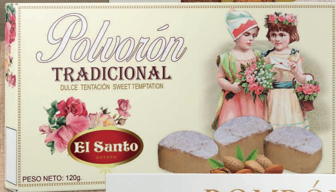
REF. 10172 Polvorón Tradicional 120 g Medidas: 290x154x30 mm 30 uds./caja 36 cajas/palet