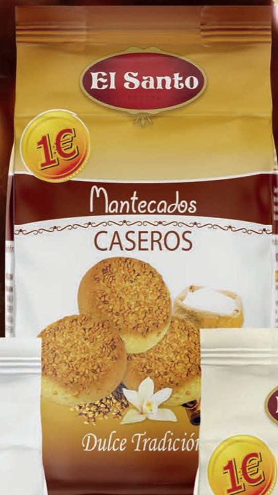
REF. 10168 Bolsa Mantecado Casero 200 g Medidas: 210x110x75 mm 12 uds./caja 72 cajas/palet