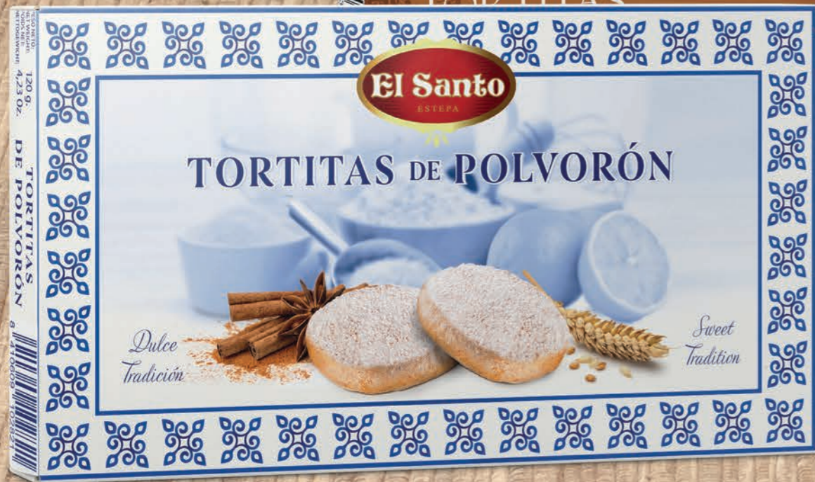
REF. 10104 Tortitas de Polvorón 120 g Medidas: 290x154x30 mm 30 uds./caja 36 cajas/palet